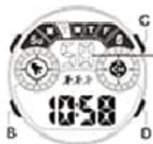
Standard time set display