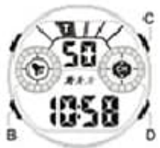
Standard time display