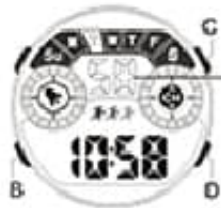
Standard time set display