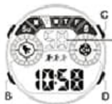
Standard time set display