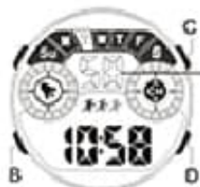
Standard time set display