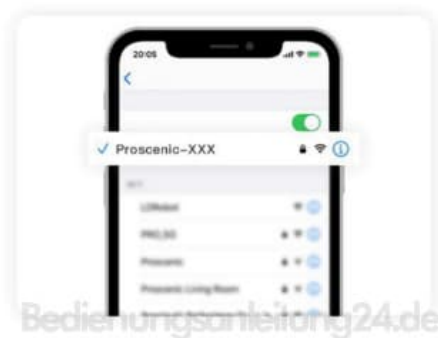
Aktuelles WLAN Fiona

9. Schalten Sie in der WIFI-Einstellungsseite das benutzende 2.4G-WLAN (z.B.Fiona) auf Proscenic-M6Pro-xxxxxx um. Kehren Sie danach zu „Proscenic Home“. Tippen Sie auf das Symbol „Nächster Schritt“.